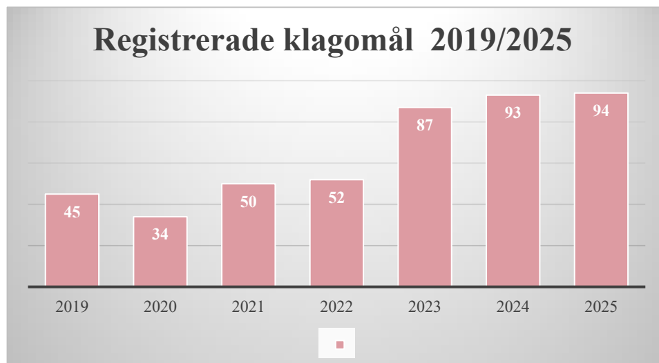
Tabell 1 Registrerade klagomål gällande dokumentation och sekretess under perioden 2019 till 2025

Under första kvartalet 2023 noterades en ökning av antalet ärenden, vilket markerade början på en uppåtgående trend som därefter har fortsatt.